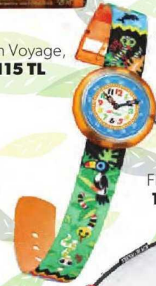
Flik Flak, 115 TL