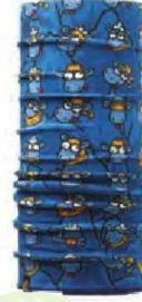
Buff Ardia, 42.90 TL