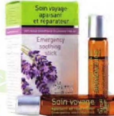
Soin Voyage, 115 TL