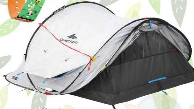
Quechua, 259.99 TL